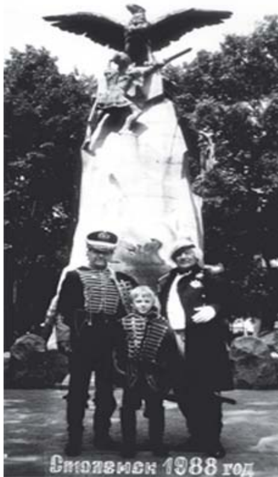
Поход по местам отступления Наполеона -I в 1812 году

Это было 1 августа 1951 года. С.Топ продолжал петь, а перед глазами пролетала вся его жизнь, которую он в обычном состоянии и не помнил. Да и откуда он мог знать, что вся его жизнь, это заранее запрограммированная Топосферой* жизнь личности, длиной всего-то в 78 лет.