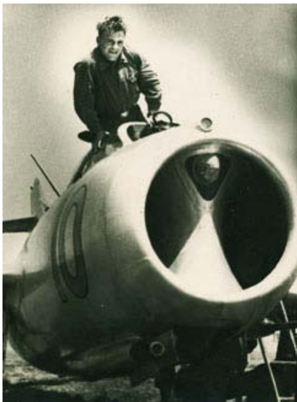
Курсант Луганского лётного училища на МИГ-15

– Не всем дано летать! Удачу свою догонять! Дорога далёкая, небо высокое, надо понимать!