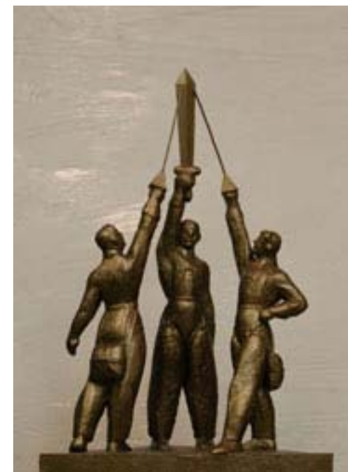
Эскиз памятника «Эскадрилья Нормандия-Неман»

Находится в городе Фрязино МО в музее «Нормандия-Неман» при гимназии.