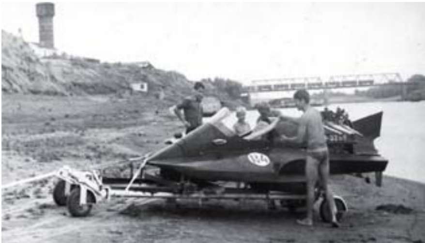
Гоночный глассер R-4 на реке Ахтуба