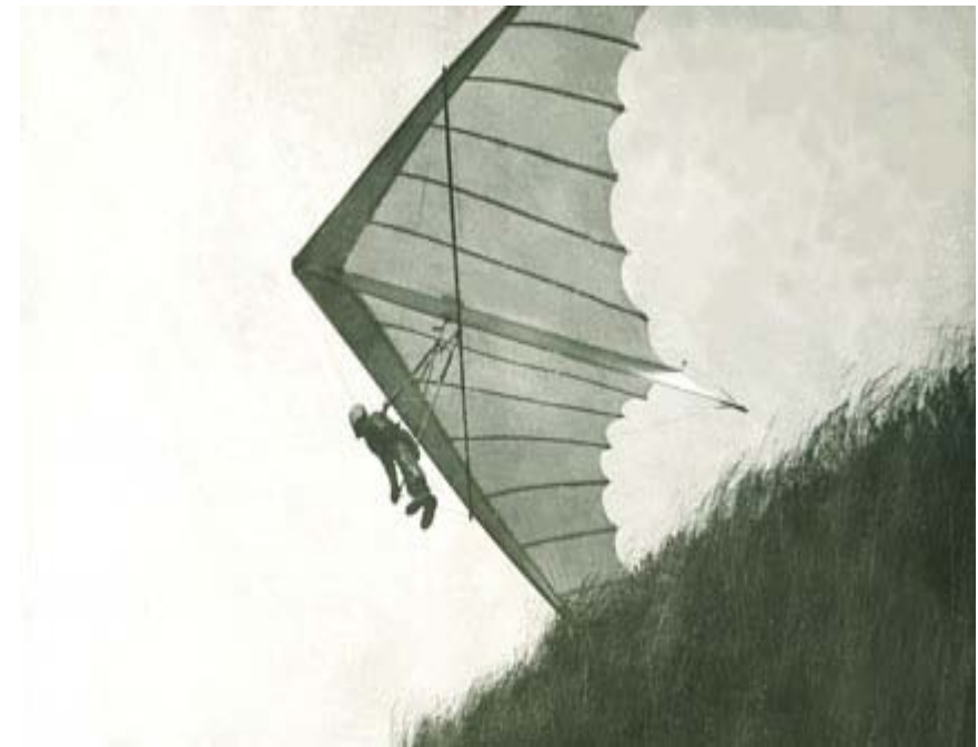
Взлёт и победа – 1 место на приз «Крякутного» в г. Рязани