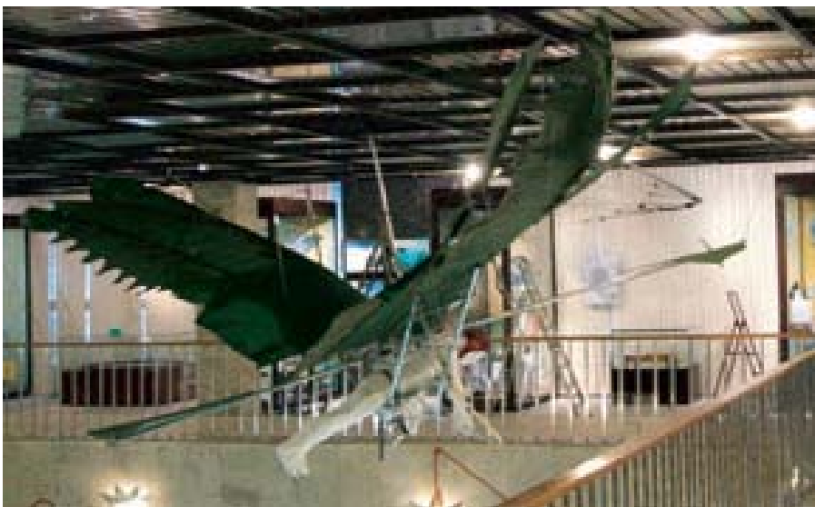
2009 год. В Дарвиновском музее в Москве «Икар-6» временно экспонировался на выставке.

ЭПИЛОГ. Взлёт в бездну правды длиною в жизнь . 411