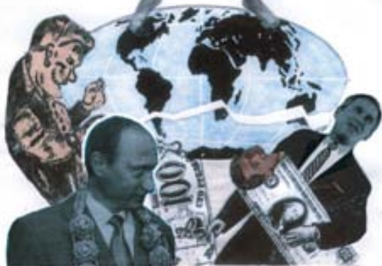
На обороте первой сторони обложки