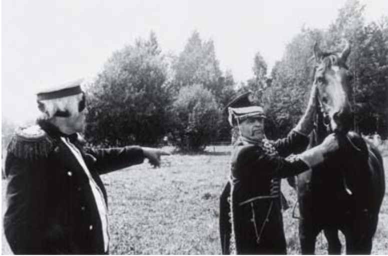
Поэт С.Топ в роли командира гусарского полка, героя Отечественной войны 1812 г., поэта и воина Дениса Давыдова.