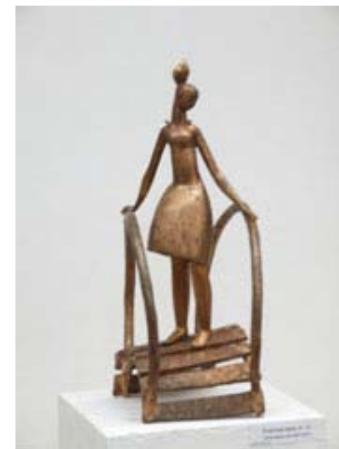
Девушка на мостике