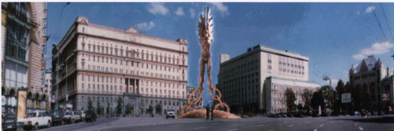
Памятник на Лубянке «Между цепями рабства и крыльями свободы»

Для прыжка надо было набрать 800 метров. А на земле все ждали этого прыжка, потому что каждого перворазника (совершившего свой первый прыжок с парашютом), всегда ставили на четвереньки, и каждый спортсмен брал запасной парашют, и бил со всего размаху по заднице новоявленного парашютиста.