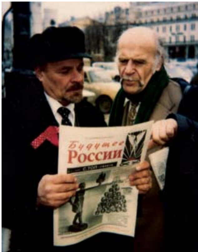
Диалог главного редактора газеты с “В. И. Лениным.”