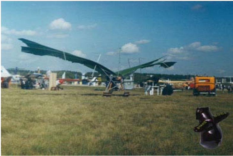
Махолёт «Икар-6» и раритет «Адам-Опель» на МАКСЕ в городе Жуковском.