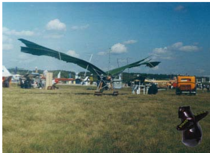
Махолёт «Икар-6» и раритет «Адам-Опель» на МАКСЕ в городе Жуковском.

Всё то, что вместе вы читали, на сайте этом – бьёт родник! Хотите всё испить до края? Извольте книгу <<ВВВ>>, купить: