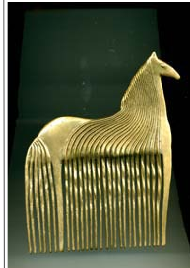
Гребень « Лошадка »