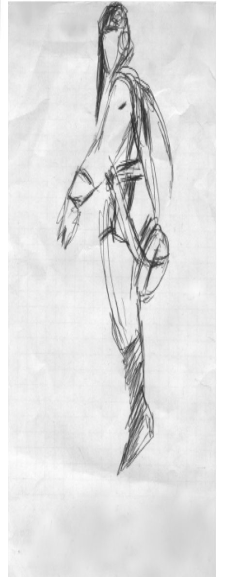
Рисунок Анны Цокотухиной