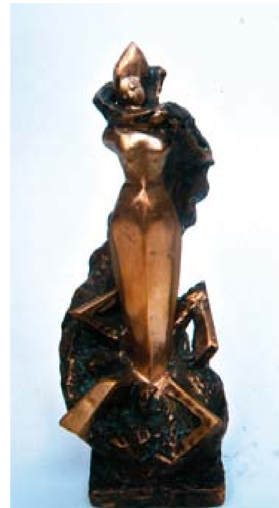
Смертью – смерть поправ... (Зое Космодемьянской)