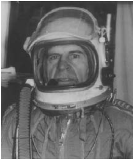
Это мой ДРУГ, лирический герой С.Топ

Это – его стихи, это – его поэтическая проза, это он говорит президенту: