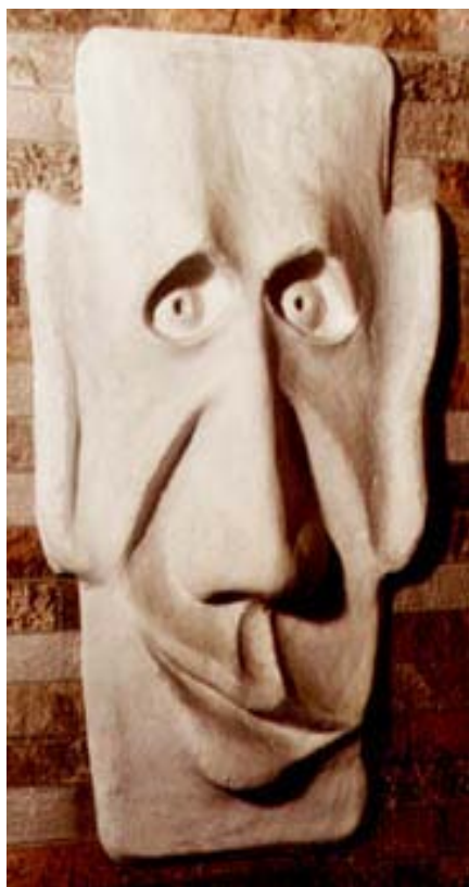
Фото-эпиграмма на КАПИТАЛИСТА