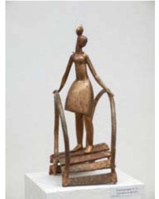
Девушка на мостике