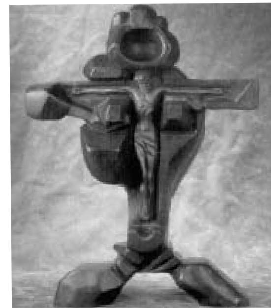
Heart of Christ

Не верь, Неизвестный, что ты уже Гений, что лучшей работой влез в “Сердце Христа”. Вторично всё то, что лишь смерть воспеваешь. Не “Жизни то Древо” – исчадие зла!