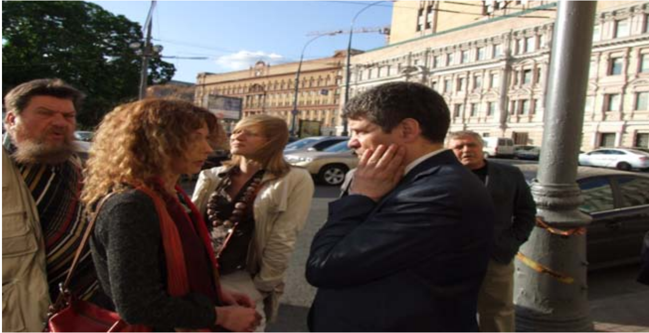
Вручение национальной премии “ПОЭТ” Евгению Рейну.