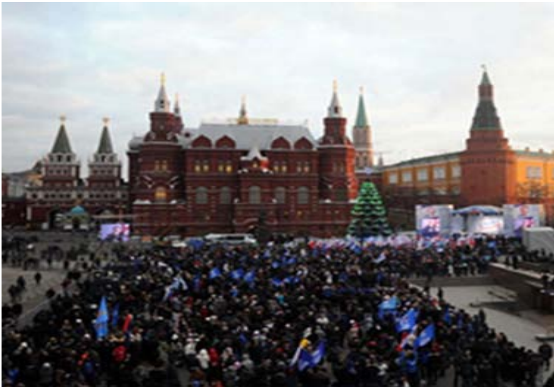
“Нашисты” за деньги в Москву прикатили, чтоб помнили “наших”, продавших отцов. Деды их, царапали кровью: “Помните дети! За вас умираю, за внуков! За социализм!”