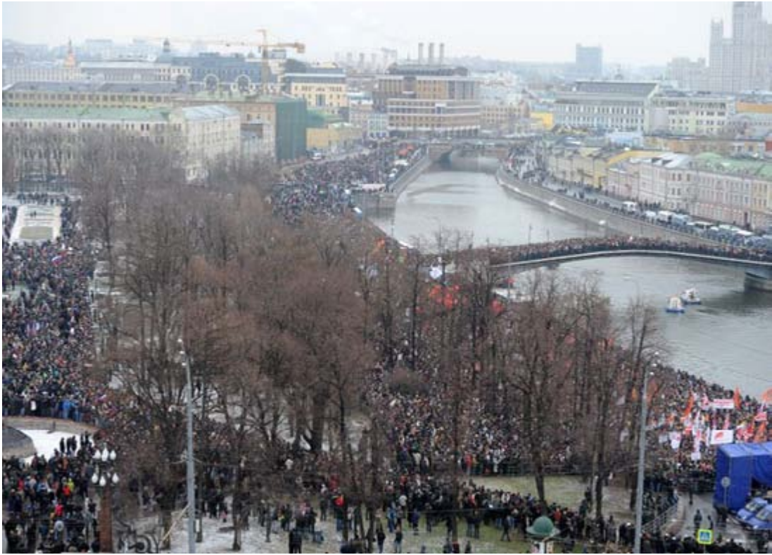
Одних на Болотную площадь спустили, чтоб помнили все, где казнили и били.